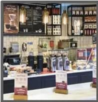
Mile Tea Store