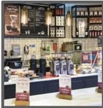
Mile Tea Store