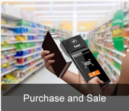
Purchase and Sale