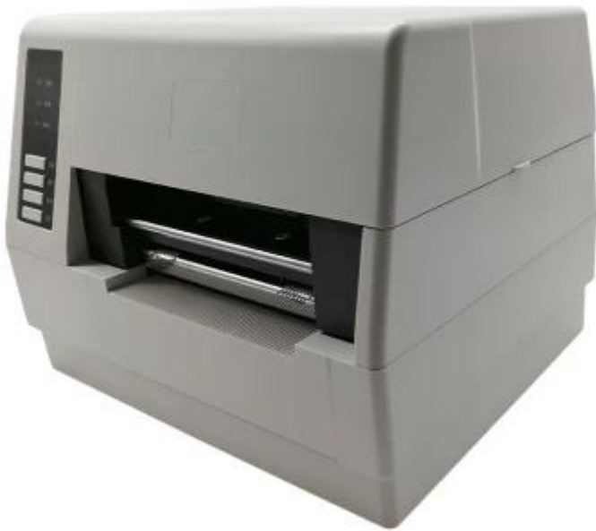
型番 / 品名OCBP -008