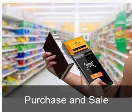
Purchase and Sale