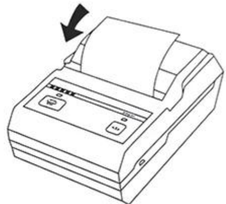
Step three Close the cover