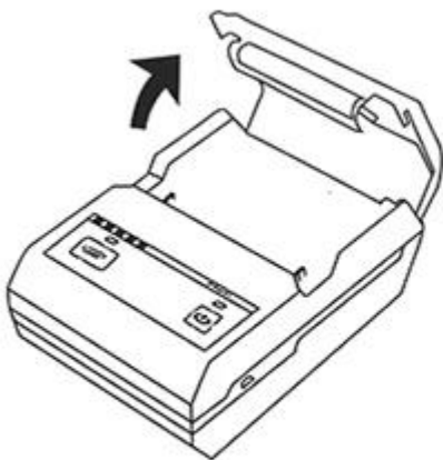
Step one Open the cover according arrow direction