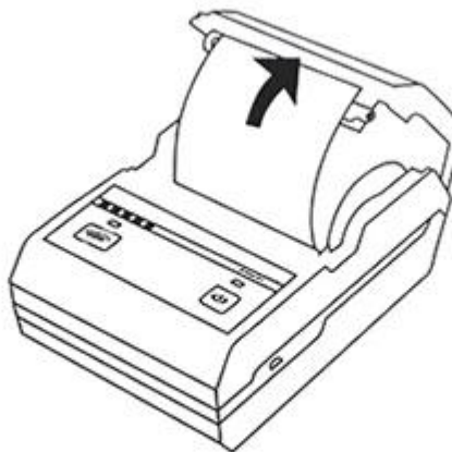
Step two Load roll paper according arrow direction