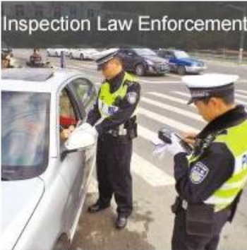
Inspection Law Enforcement