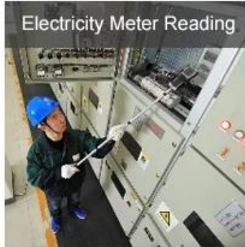
Electricity Meter Reading