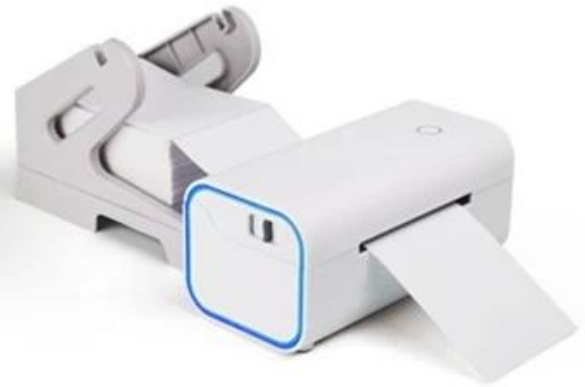
Print stacked labels