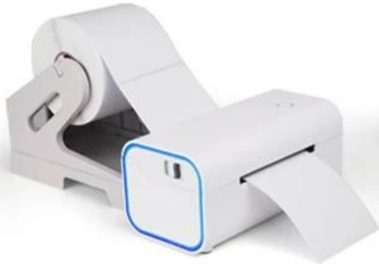
Print roll label