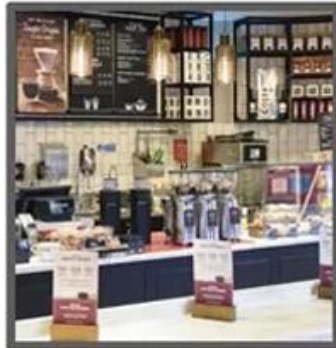
Mile Tea Store