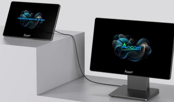
With one line connection 2nd screen