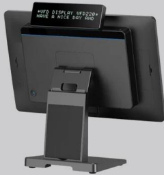
With customer display