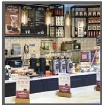
Mile Tea Store