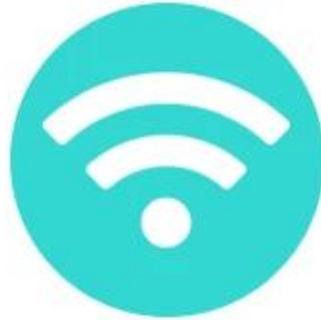
2.4G+5G Dual Mode WIFI