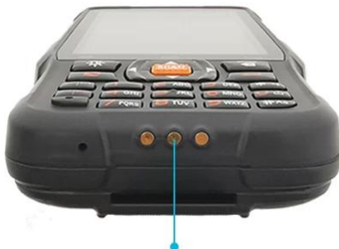
POGO PIN Interface

Professional POGO PIN interface, fast charging, reduce the loss of batteries and mainframe at the same time.