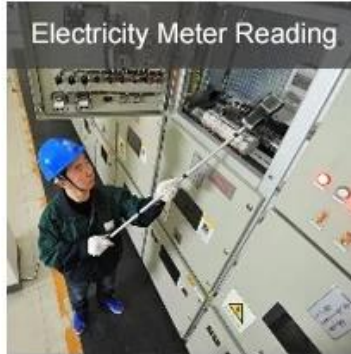
Electricity Meter Reading