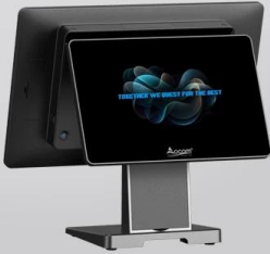
With one line connection 2nd screen