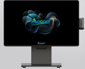
With customer display