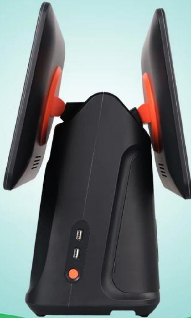
Pojedynczy ekran rodzaj