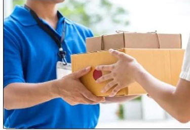
Express & Logistics