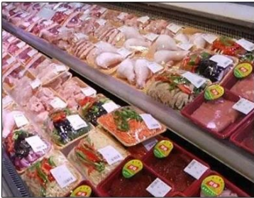
Fresh Food Supermarket