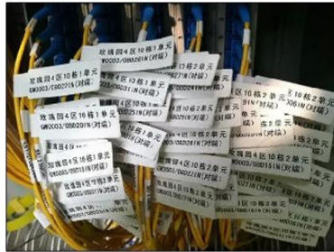
Network Information Label