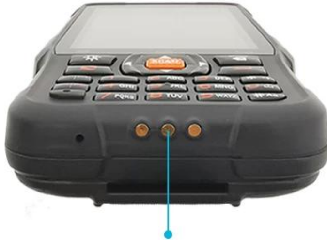
POGO PIN Interface

Professional POGO PIN interface, fast charging, reduce the loss of batteries and mainframe at the same time.