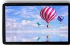
↙ ↘ 15.6 inch