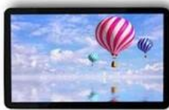
↙ ↘ 15.6 inch