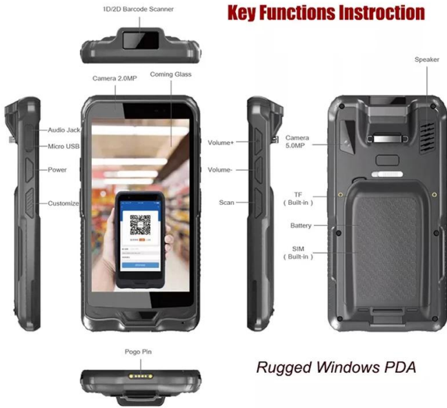
Rugged Windows PDA