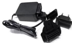
3 in 1 Adapter

Note: Please contact with the sales if you need any of these accessories.