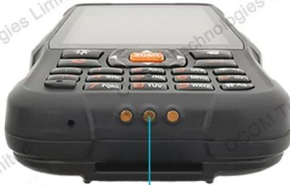
POGO PIN Interface

Professional POGO PIN interface, fast charging, reduce the loss of batteries and mainframe at the same time.