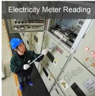
Electricity Meter Reading